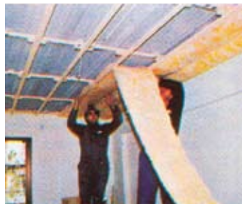
2. Τοποθέτηση μόνωσης