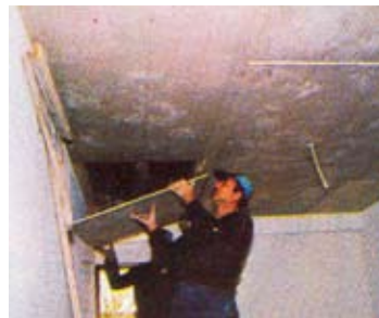
4. Επένδυση με γυψοσανίδα