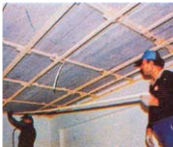
1. Καδρονάρισμα οροφής

Χωρίς γκρεμίσματα, αν το σπίτι είναι έτοιμο, η ESWA τοποθετείται εύκολα και απλά στην οροφή, με ξύλινα καδρονάκια, ή μεταλλικά (στραντζαριστά) που αποτελούν τον σκελετό της οροφής, υαλοβάμβακα για θερμομόνωση και ηχομόνωση, κλείνοντας την οροφή με θαμμάσια αρχιτεκτονική επένδυση από γυψοσανίδα ή ξύλο ραμποτέ, όπως φαίνεται στις διπλανές εικόνες. Στο τέλος η γυψοσανίδα βάφεται με πηλαστικό χρώμα ή ρελιέφ και η εγκατάσταση γίνεται αόρατη.