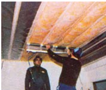
3. Τοποθέτηση του στοιχείου ESWA